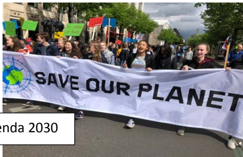
Projekttag: Agenda 2030