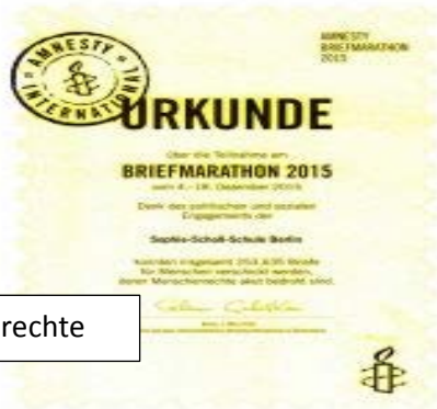
Tag der Menschenrechte